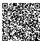
フェイスブック QRコード

図書館には、調べ物のお手伝いをするサービスがあります。本についての問い合わせ以外にも、身近な疑問についてもお調べしていますので、お気軽にご利用ください。