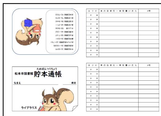
大きめのライブラリス(表紙)