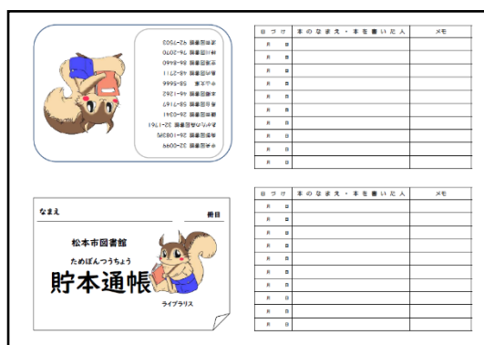
小さめのライブラリス(表紙)