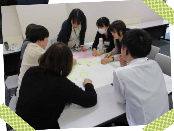
◀ 職員ワークショップの様子 ▶ (2019年12月開催)

毎月第4金曜日には、市内図書館の職員が集まって、図書館に関するさまざまなことについてディスカッションや研修などを行っています。