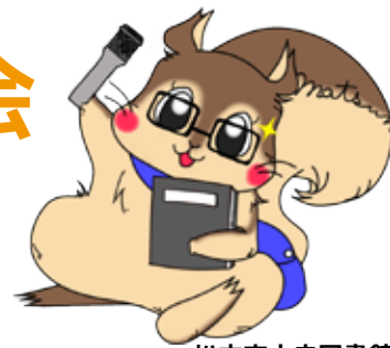
松本市中央図書館 マスコットキャラクター ライブラリス

さまざまな視点から松本の図書館の未来について意見をいただくために 委員会が開かれました！