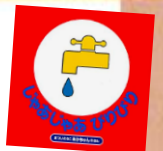
『じゃあじゃあびりびり』